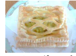
スイートポテトパイ