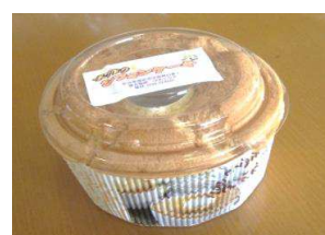
シフォンケーキ(大)