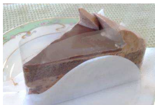
チョコレートケーキ