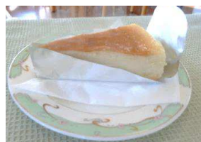
ベイクドチーズケーキ