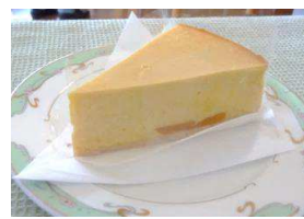
かぼちゃのチーズケーキ