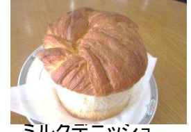
ミルクデニッシュ